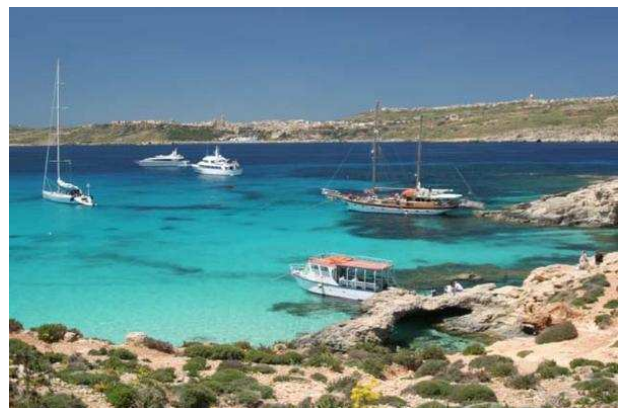
Le lagon bleu / bleu lagoon

Avec 2,7 km 2 de surface, Comino est la plus petite île de l'archipel et il y fait très tranquille. Seuls quelques paysans y habitent. Pour le tourisme, il n'y a qu'un seul hôtel mais parfaitement équipé pour les sports nautiques. Pour les amoureux de la mer, l'île est un vrai paradis car Comino regorge de nombreuses baies et l'eau cristalline d'un bleu-azur offre les conditions idéales pour la plongée sous-marine .