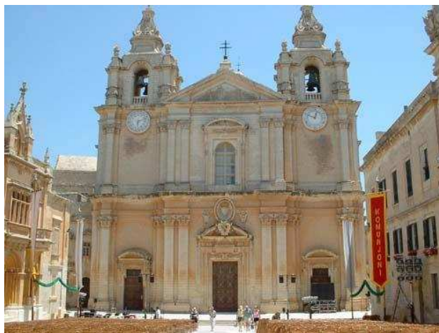
La cathédrale Saint Paul

La seule Cathédrale de Malte, la cathédrale Saint Paul , se trouve en plein centre de Mdina et offre un magnifique panorama.